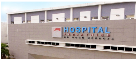
Hospital Pediátrico Dr. Hugo Mendoza - Sto. Dgo. R.D. Servicio de Gastroenterología y Nutrición Pediátrica