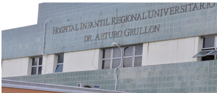
Hospital Infantil Regional Universitario Dr. Arturo Grullón - Santiago, R.D. Servicio de Gastroenterología y Nutrición Pediátrica